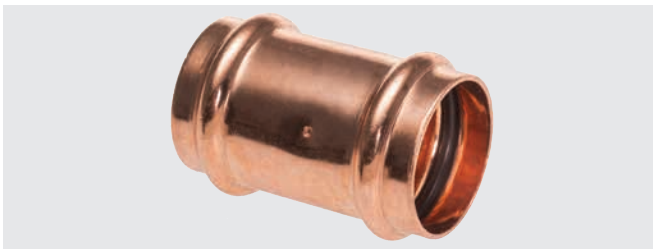
>B< Press Kontur 12–54 mm (B-Kontur)

Die von uns eingesetzten Dichtelemente entsprechen den Vorgaben der Elastomer-Leitlinie des Umweltbundesamtes und sind gemäß DVGW-Prüfgrundlage W270 für den Einsatz in Trinkwasser geeignet.